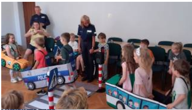
KOMENDA POWIATOWA POLICJI w PISZU