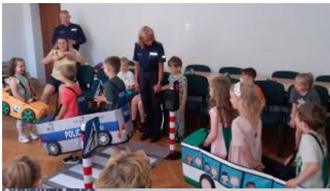
KOMENDA POWIATOWA POLICJI w PISZU